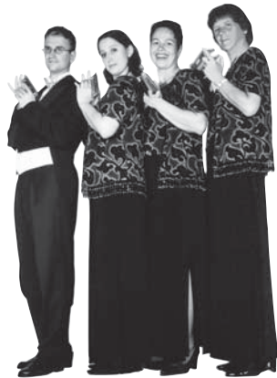
Mundharmonikaquartett „Harmonicamento“ www.harmonicamento.de